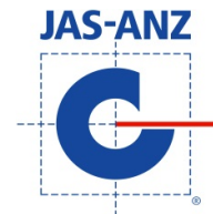
ISO9001, 14001 共通